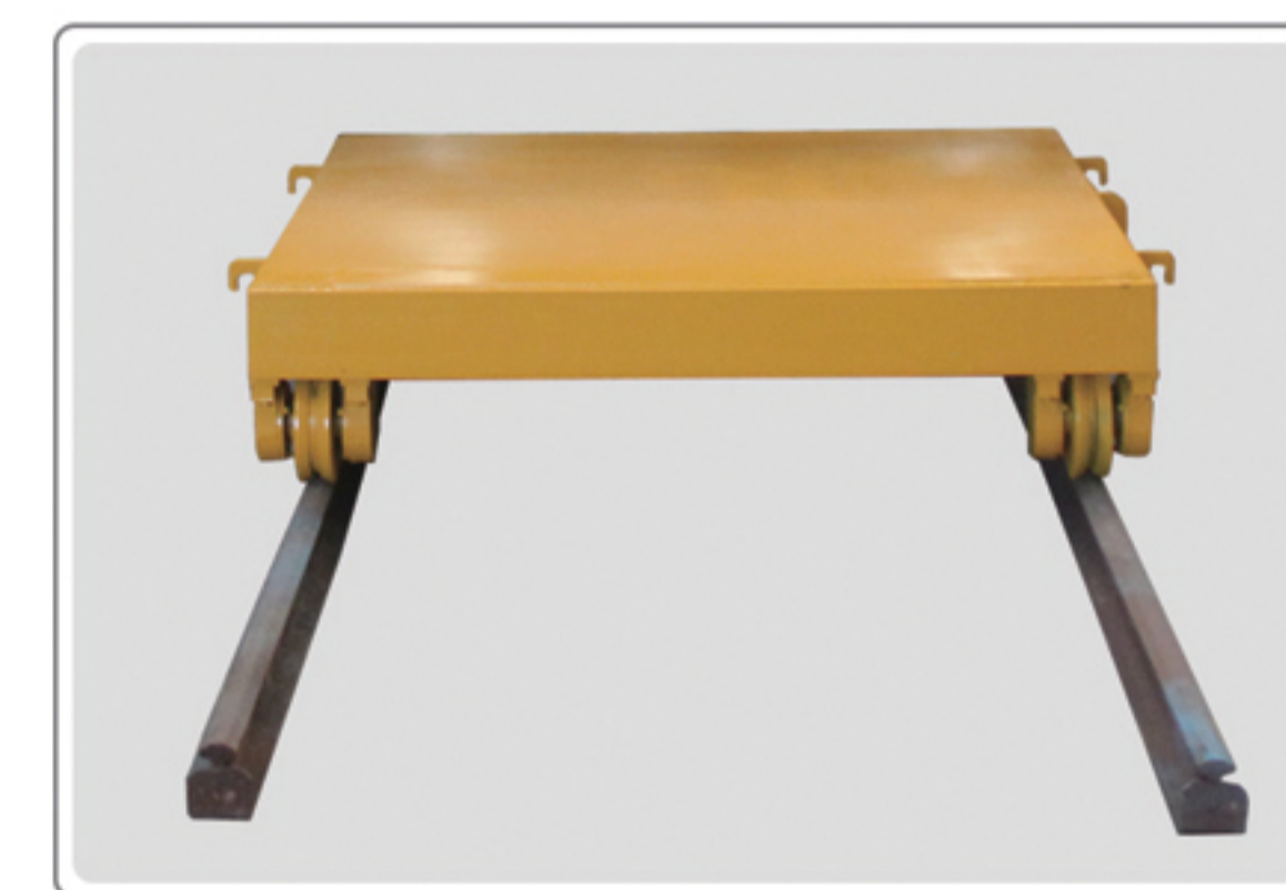
台车 (可选) Trolley (Optional)