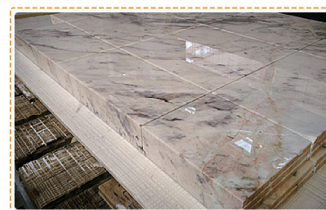
一键式全自动纵横切割;