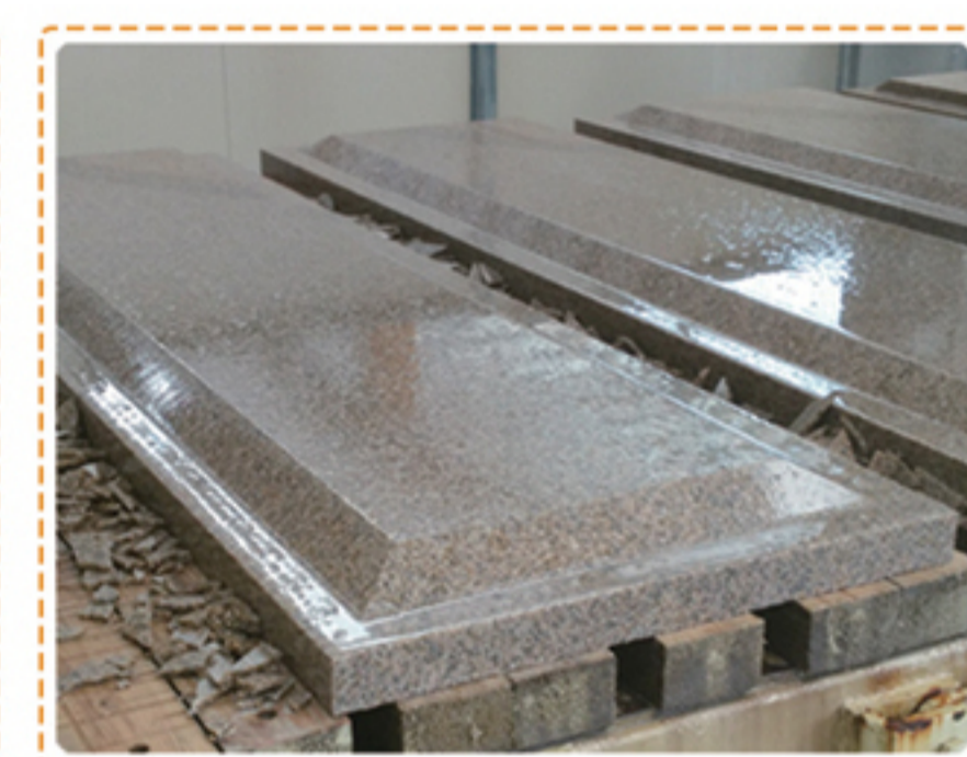
0^{\circ} - 90^{\circ} - 180^{\circ} - 270^{\circ} 全自动定位 倒角切割