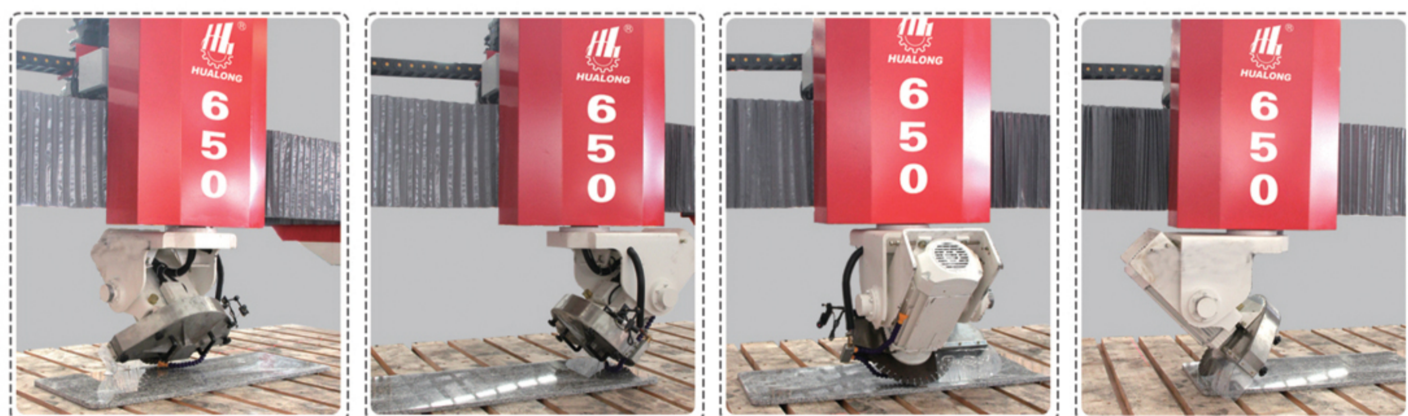
0^{\circ} - 90^{\circ} - 180^{\circ} - 270^{\circ} 全自动定位倒角切割